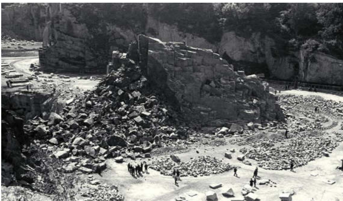
Bundesarchiv, Bild 192-320 Foto: o. Ang. | 1941/1942

По своему режиму Маутхаузен относился к последней, третьей категории и являлся одним из самых жестоких концлагерей. Здесь на каждого заключенного заполняли специальную карточку и выдавали бирки с выбитыми на жестяной полоске номерами. Потеряешь бирку - смерть.